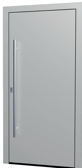
MS 06 Ud-Wert: 0,68 Farbe: White Aluminium FSM