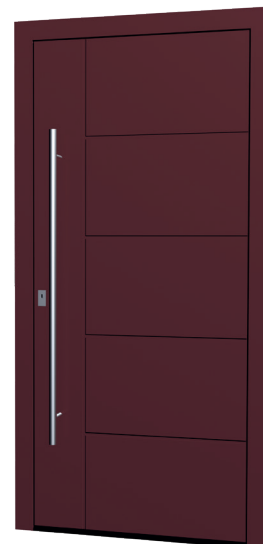
MS 10 Ud-Wert: 0,68 Farbe: ca. RAL 3004 Purple FS