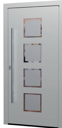
MS 05 Ud-Wert: 0,86 Farbe: White Aluminium FSM