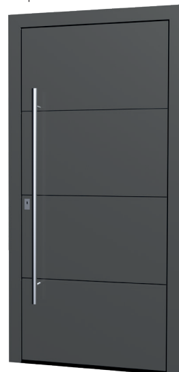
MS 09 Ud-Wert: 0,68 Farbe: Sparkling Iron FSM