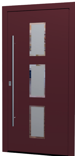
MS 07 Ud-Wert: 0,83 Farbe: ca. RAL 3004 Purple FS