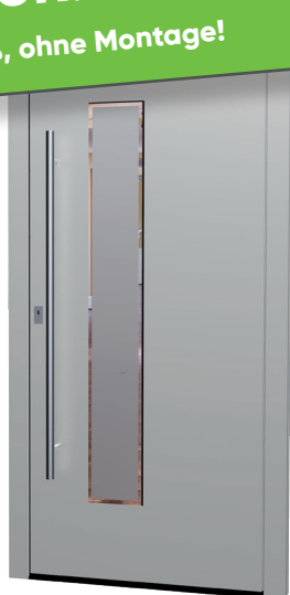
MS 02 Ud-Wert: 0,81 Farbe: White Aluminium FSM