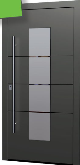
MS 03 Ud-Wert: 0,84 Farbe: Sparkling Iron FSM