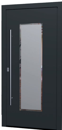
MS 08 Ud-Wert: 0,88 Farbe: Dark FSM