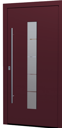
MS 04 Ud-Wert: 0,80 Farbe: ca. RAL 3004 Purple FS