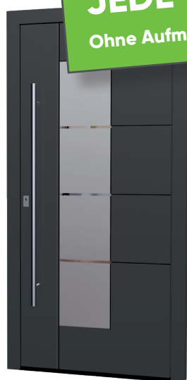
MS 01 Ud-Wert: 0,85 Farbe: Dark FSM

JEDE TÜR: 2.799,- €* Ohne Aufmaß, ohne Montage!